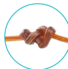
Multifilament răsucit cu finisare monofilament