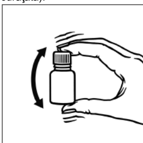
1. A se agita înainte de utilizare.