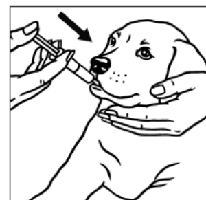
4. Administrați Procox în cavitatea bucală a câinelui.