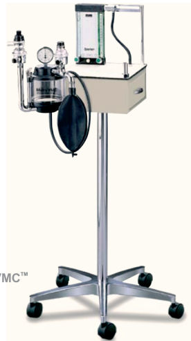
Matrix Spartan VMC™

Se poate obține ușor nivelul de absorbție de 1.500 cc Co 2 prin înlocuirea ușoară a absorbantului (permite utilizarea canistrelor preambalate sau a absorbantului de 1350gm).