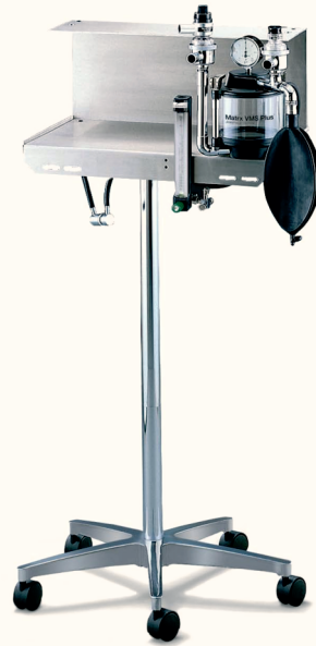
Matrix VMS™ Plus