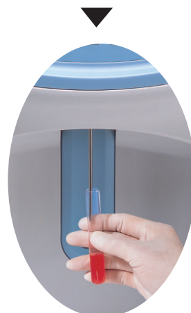
Pasul 2 - Procedurile de aspirație și diluare complet automate