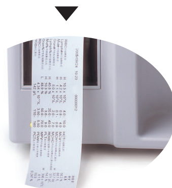
Pasul 4 - Posibilitatea selectării formei de tipărire